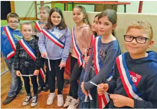
Présentation de leurs travaux lors de la cérémonie des vœux

De belles initiatives et encore plein de projets pour la nouvelle équipe encadrée par la commission "enfance, école"