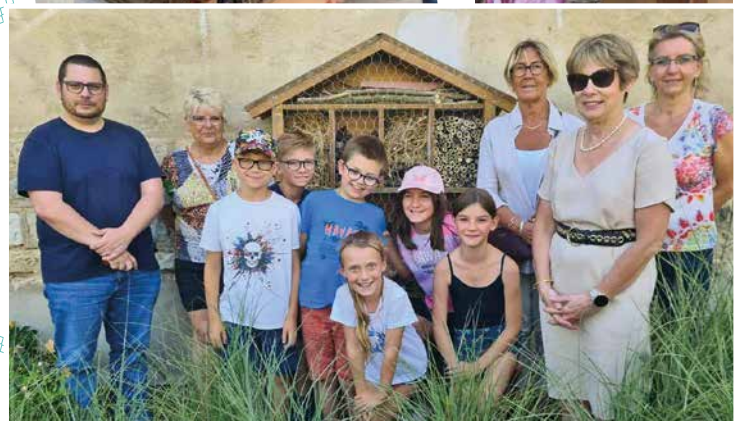
Fabrication d'un hôtel à insectes à base de matériaux recyclés avec l'aide de papas que nous tenons à remercier. Il est installé place Eugénie BRAZIER.