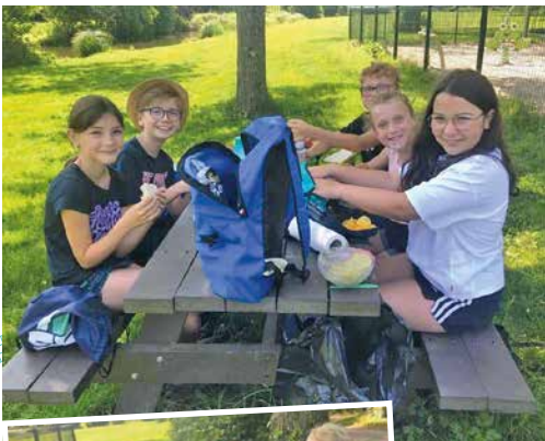
Pique-nique au plan d'eau