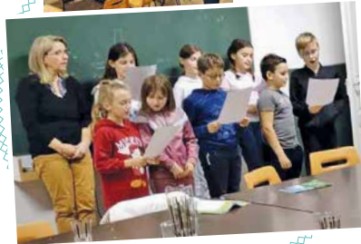
Chants lors des commémorations des 8 mai et 11 novembre