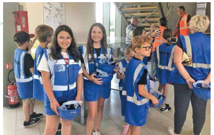
Visite de la déchetterie Organom à Viriat