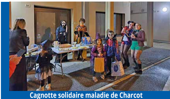
Cagnotte solidaire maladie de Charcot

Nous espérons que ces nouveautés contribueront à vous faire venir toujours plus nombreux dans notre magasin.