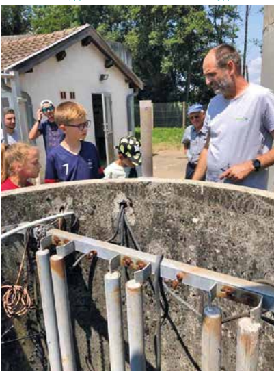
Visite de la station d'épuration à Dompierre