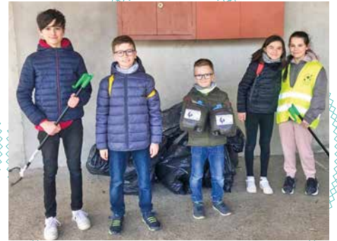
Nettoyage de printemps : encore trop de déchets !