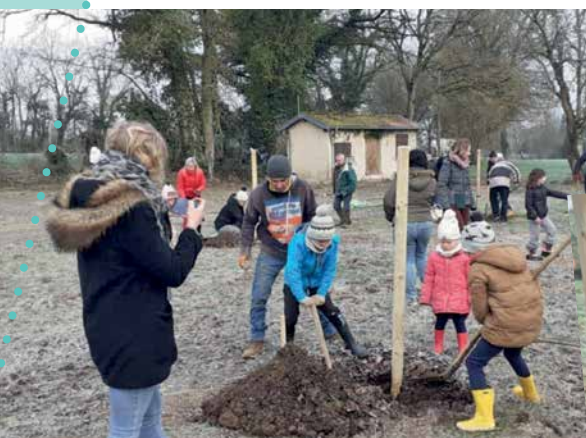
Plantation d'un verger

De belles initiatives et encore plein de projets pour la nouvelle équipe encadrée par la commission "enfance, école"