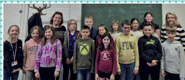
Echanges avec le CME de St André sur Vieux Jonc