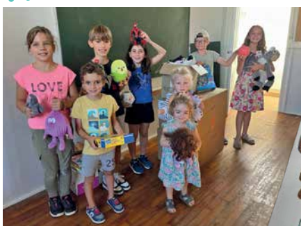
Echange avec l'association MTC Actions Humanitaires au Bénin (visio, collecte)