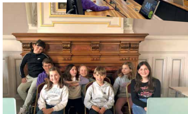
Visite du conseil départemental